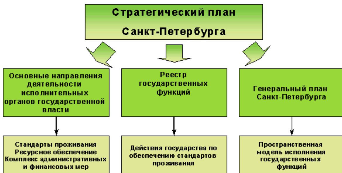
Рис. 5.12. Состав стратегического плана Санкт-Петербурга

Базой для формирования Стратегического плана города являются основные качественные и количественные требования, содержащиеся в Концепции социально-экономического развития Санкт-Петербурга. Стратегический план это совокупность правовых актов, включающая в себя научно обоснованную систему целей социально-экономического развития мегаполиса и мероприятий по их достижению, основные направления деятельности исполнительных органов государственной власти, реестр государственных функций Санкт-Петербурга Генеральный план (рис. 5.12.).