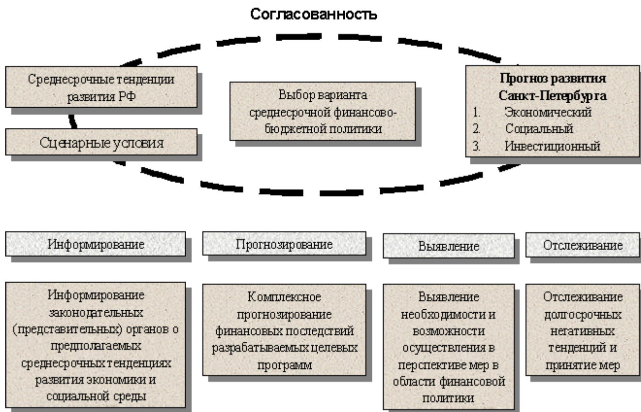
Рис. 5.13. Основные цели разработки среднесрочного финансового плана