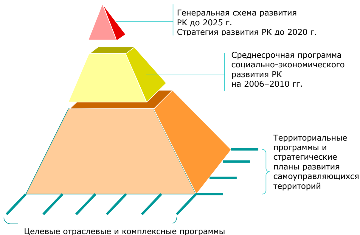
Рис. 1.11. Система плановых документов